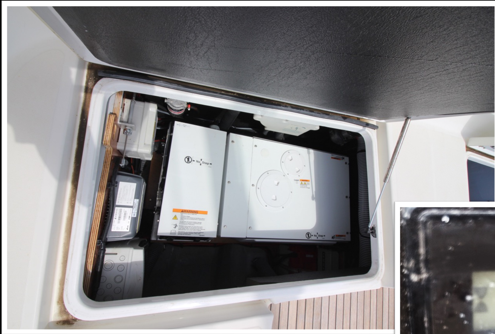
GENSET: 157 Hs.