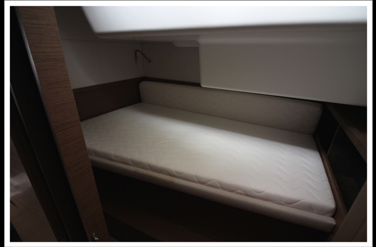
BERTH IN FORECAST PORT