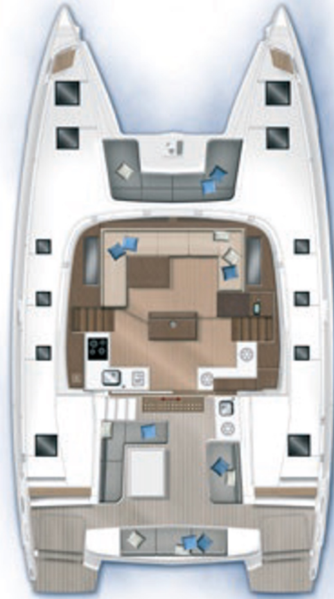
Saloon and cockpit