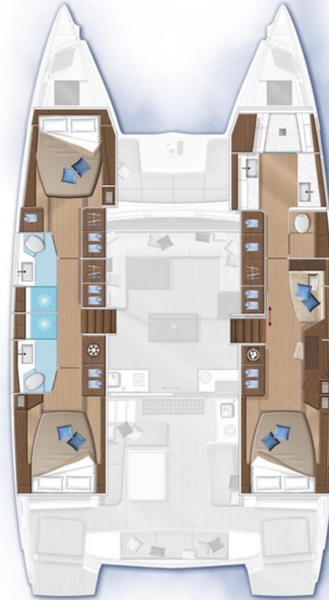
3 cabins | 3 heads